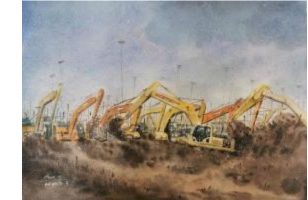
艺术学院教师 张春松 《工地》

编辑部地址:河北·秦皇岛 河北科技师范学院党委宣传部 邮编:066004 电话:0335-8076532