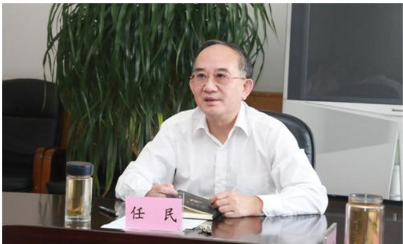
本报讯(记者 孙艳敏 朱洪英)10月1日上午,校党委理论学习中心组全体人员在秦皇岛校区11楼大会议室,认真聆听了中共中央总书记、国家主席、中央军委主席习近平在庆祝中华人民共和国成立70周年大会上的重要讲话。

习近平总书记指出,教育是国之大计,党之大计,坚持把服务中华民族伟大复兴作为教育的重要使命。他还特别指出党和国家事业发展对高等教育的要求,对科学知识和优秀人才的需要。